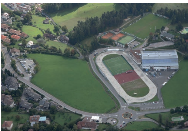
Der Fußballplatz (rechts im Hintergrund) im Sportgebiet beim Eising in Klobenstein wird erweitert, hinter der Arena soll ein Kletterturm errichtet werden.