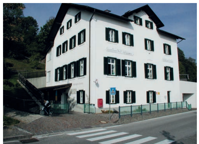
Die alte Grundschule von Oberinn wird energetisch saniert und ausgebaut.