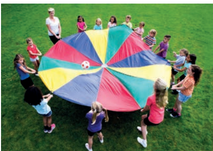
Der Gemeindevorschuss unterstützt verschiedene Antragsteller bei der Durchführung der Sommerbetreuung.

Der Tourismusverein Ritten führt bestimmte Aufgabenbereiche und Dienst-