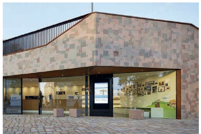
Für die Abwicklung der verschiedenen Tätigkeiten gewährte der Gemeindevorschuss dem Tourismusverein einen Beitrag in Höhe von 125.000,00 Euro. Im Bild das Büro des Tourismusvereins am Bahnhof in Oberbozen.