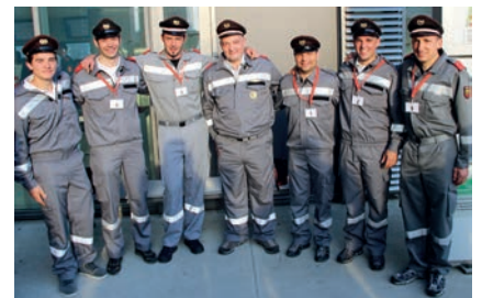
Die Freiwilligen Feuerwehren vom Ritten erhielten einen außerordentlichen Beitrag der Gemeinde für den Ankauf von persönlicher Schutzausrüstung