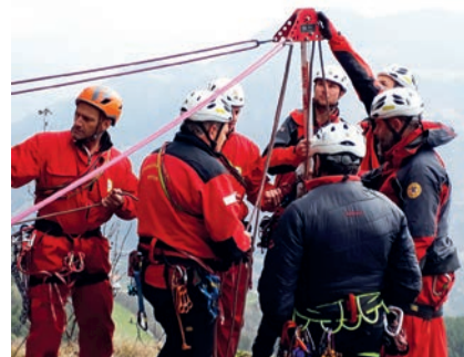
Für den Bergrettungsdienst gewährte die Gemeinde einen Beitrag für die ordentliche Tätigkeit für das Jahr 2022