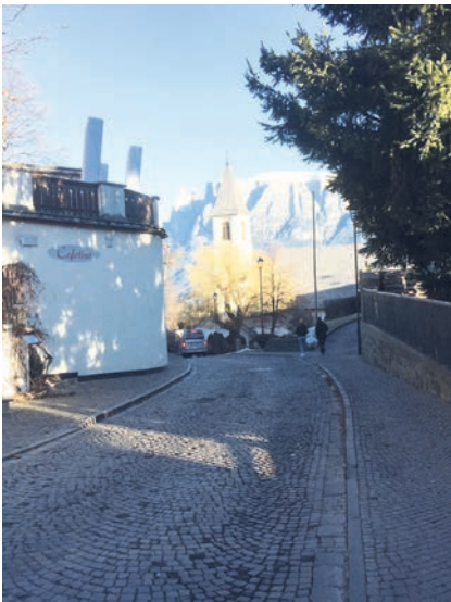
Ab Mitte Oktober wird der Bereich Strickerboden, von der Landesstraße bis zur Antonius-Kirche, systemiert

Mit Beschluss der Landesregierung wurden die Richtlinien für die Finanzierung der Kindertagesstätten und des Tagesmütter-/Tagesväterdienstes genehmigt. Laut diesem Beschluss werden die Dienste der Kindertagesstätten und der Tagesmütter/Tagesväter gemeinsam von den Nutzerfamilien, von der Wohnsitzgemeinde und von der Autonomen Provinz Bozen finanziert. Der Tarif pro Stunde zu Lasten der Nutzerfamilien beträgt grundsätzlich 3,65 Euro. Die Familien können aber je nach Einkommens- und Vermögenslage einen Antrag um Reduzierung des Stundentarifes bis auf 0,90 Euro an die Gemeinde stellen. In Folge eines solchen Antrages um Tarifbegünstigung muss eine Beurteilung der Einkommens- und Vermögenssituation der Familie gemacht werden, um den effektiven Betrag zu Lasten der Nutzerfamilie zu bestimmen. Für diese Tarifberechnung ist die Gemeinde zuständig. Der Ausschuss beschloss, die Bezirksgemeinschaft Salten-Schlern mit der Erhebung der Einkommens- und Vermögenssituation der Familien, mit der Berechnung der entsprechenden Tarifbeteiligungspflichten und mit der