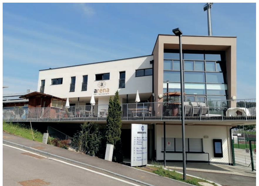
Die Führung des Bar- und Restaurantbetriebes im Sportgebäude von Klobenstein sowie des Kiosks bei den Tennis- und Fußballplätzen wird ab 1. Mai 2023 für fünf Jahre neu vergeben.